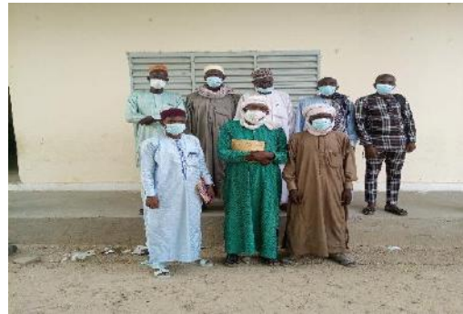
Photo 54: Photo de famille avec le groupement des hommes producteurs (agriculture , producteur semenciers, pêche et élevage ) de Bol