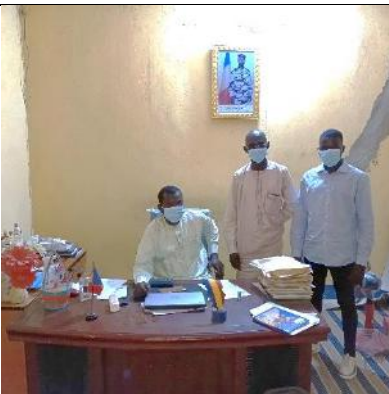
Photo 11: entretien avec le chef d'antenne d'Abéché de l'Office National des Médias Audiovisuels (personnalité assise dans son bureau).