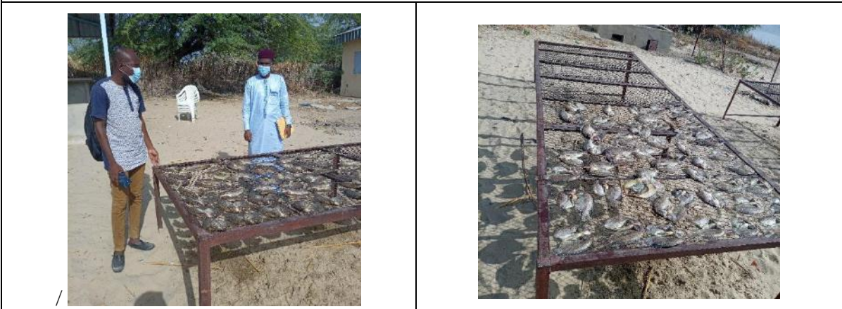
Photo 59: dispositif de séchage du poisson sur le site de koudouboul