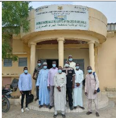
Photo 10: photo de famille de l'entretien avec le personnel de l'Agence Nationale de Lutte anti Acridienne (ANLA).