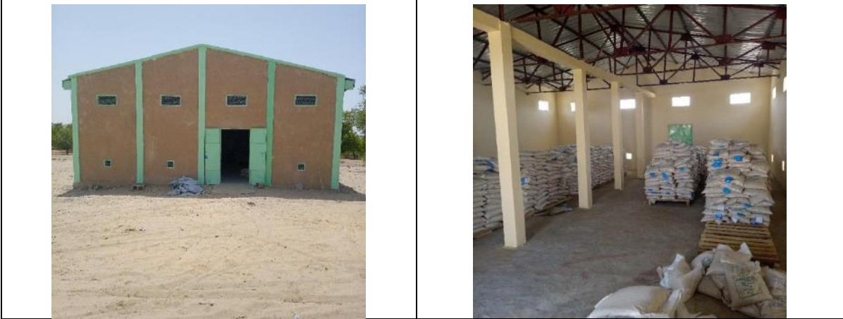
Photo 60: magasin de stockage des semences Photo 61: magasin de stockage des semences

Source : Mahamat, 18/06/2023 Source : O .Ismaël, 18/06/2023