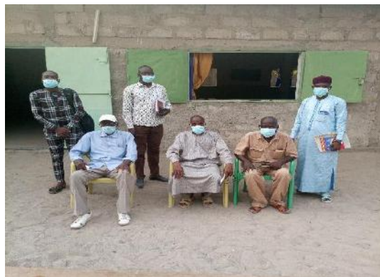
Photo 55: Entretien avec les représentants des églises évangéliste de Bol