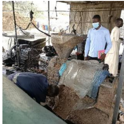
Photo 21: l'étape de la transformation de l'arachide en huile ou en tourteaux