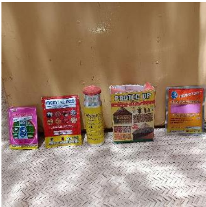
Photo 34: échantillons des produits phytosanitaires commercialisés au marché d'Abéché.