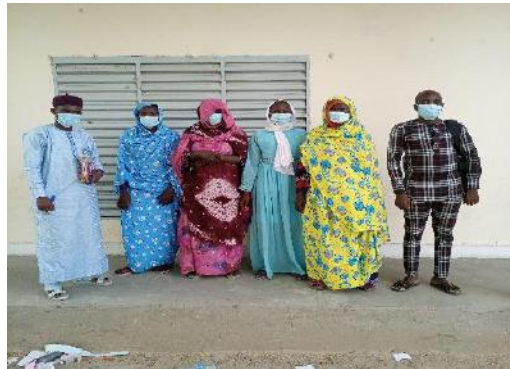
Photo 53: Photo de famille avec le groupement des femmes productrices de Bol