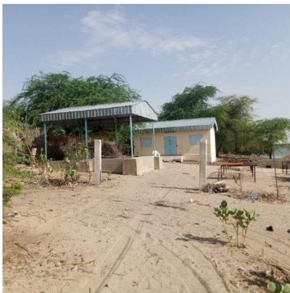
Photo 65: une vue du dispositif de séchage du poisson des pêcheurs de koudouboul