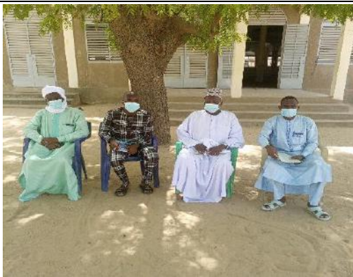
Photo 52: Photo de famille avec les représentants des associations et ONG de lutte contre les VBG et l'action sociale de Bol