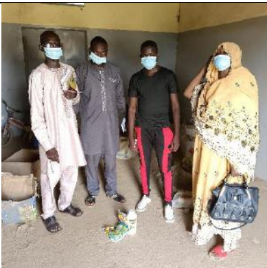
Photo 9: entretien avec le chef de base phytosanitaire. (deuxième personnalité de la gauche vers la droite).