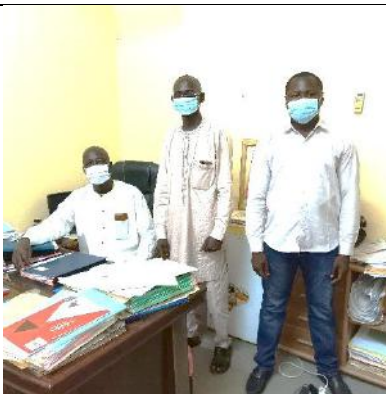
Photo 12: entretien avec le directeur de cabinet du gouverneur de la province du Ouaddaï (personnalité assise dans son bureau)