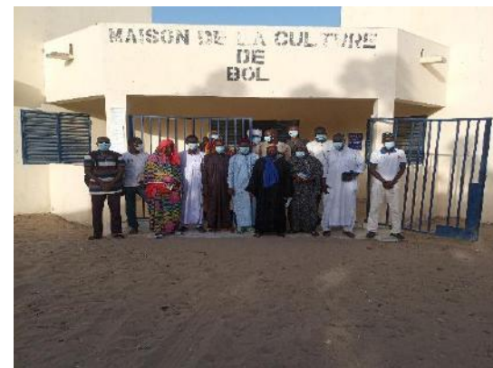
Photo 58: entretien avec le responsable vulgarisation de la SODELAC de Bol