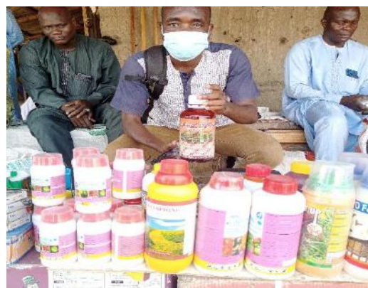
Photo 69: une vue des pesticide et herbicides vendus sur le marché local produit venus du nigeria