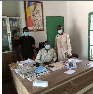
Photo 8: entretien avec le secrétaire de la délégation provinciale de l'environnement, de la pêche et du développement durable (personnalité assise dans son bureau).