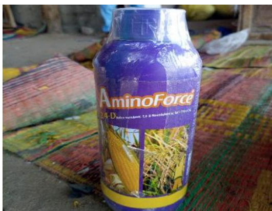
Photo 68: herbicide non homologués pour le maïs vendu sur le marché local